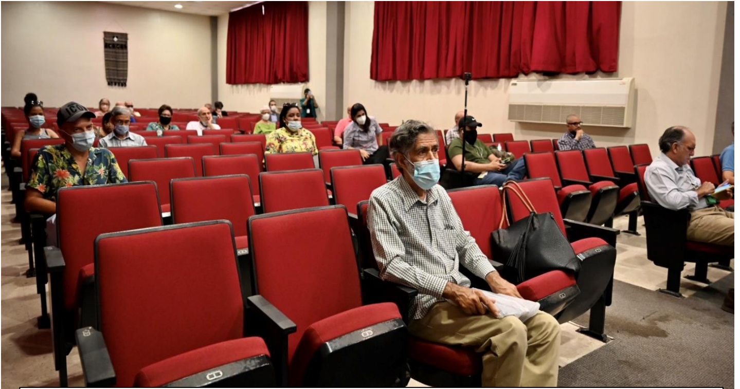
Parte del público asistente a la consulta