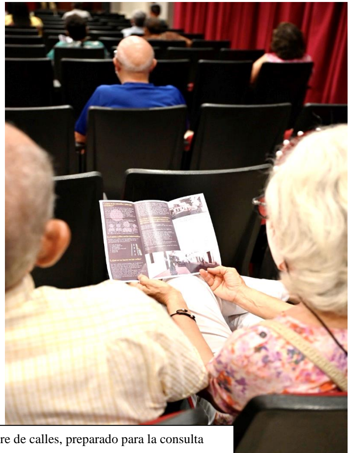
Participantes en la consulta, revisan el brochure de calles, preparado para la consulta